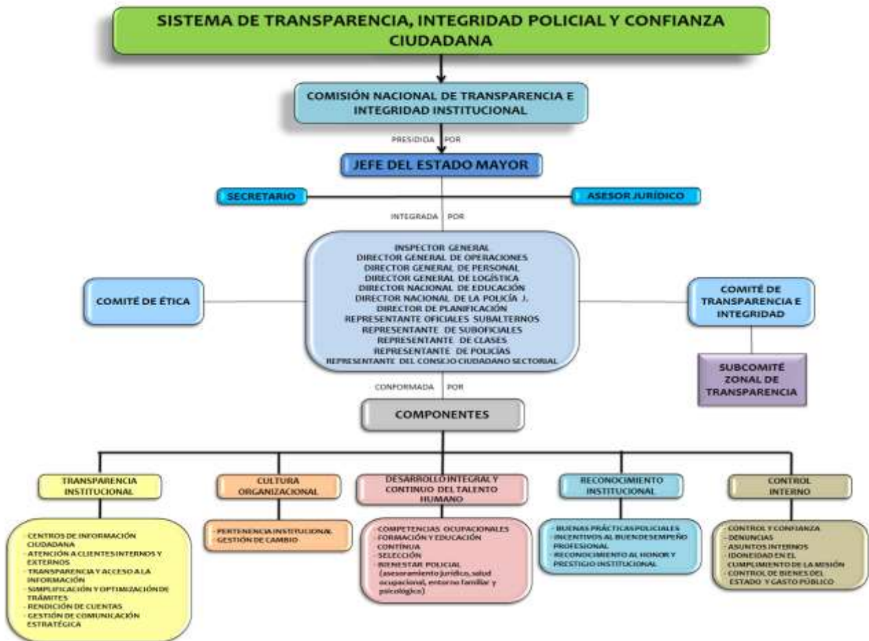
Figura No. 3.- Estructura de funcionamiento del Sistema de Transparencia, Integridad Policial y Confianza Ciudadana.

Elaborado por: Equipo de la Jefatura de Estado Mayor de la P.N.