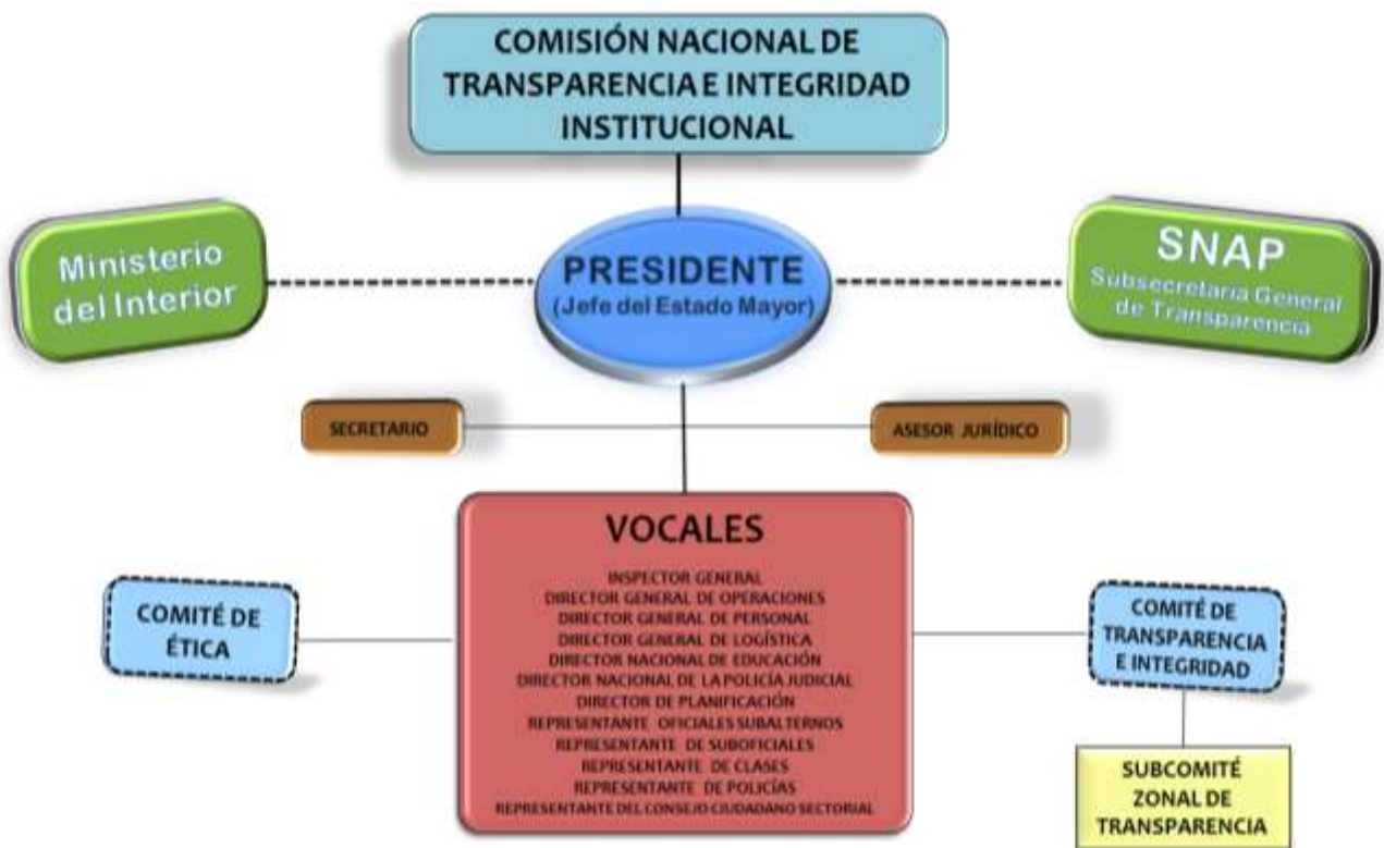
Figura No. 2.- Conformación de la Comisión Nacional de Transparencia e Integridad Institucional

Elaborado por: Equipo de la Jefatura de Estado Mayor de la P.N.