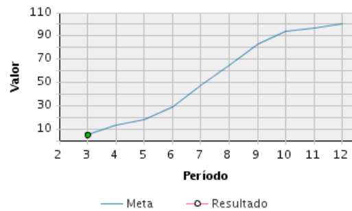
AVANCE FÍSICO PROGRAMADO VS. REAL

Transcurrido: 8.17 % Fecha de Inicio: 01/03/2015 Fecha de Fin: 31/12/2015